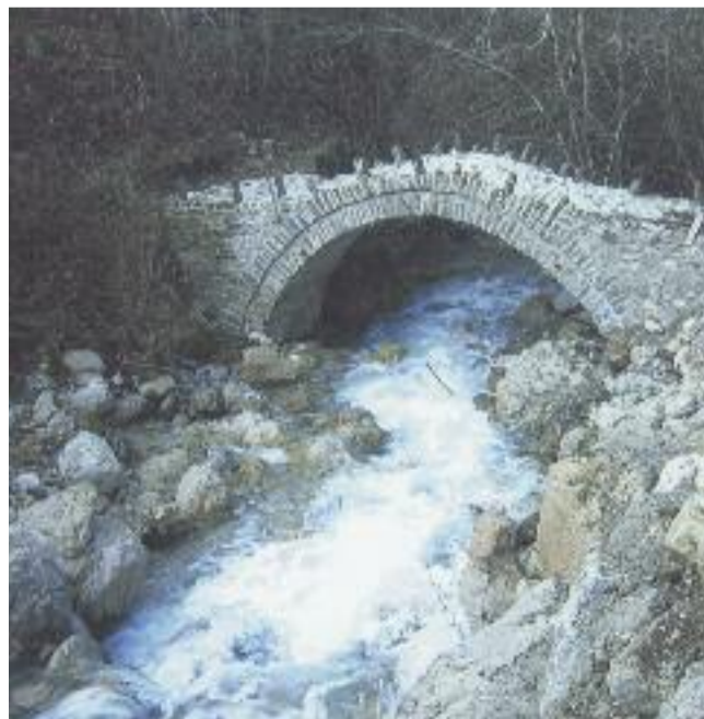
Επισκευασμένη μετά τις δυνατές βροχές από 19/11 έως 2/12/2017.