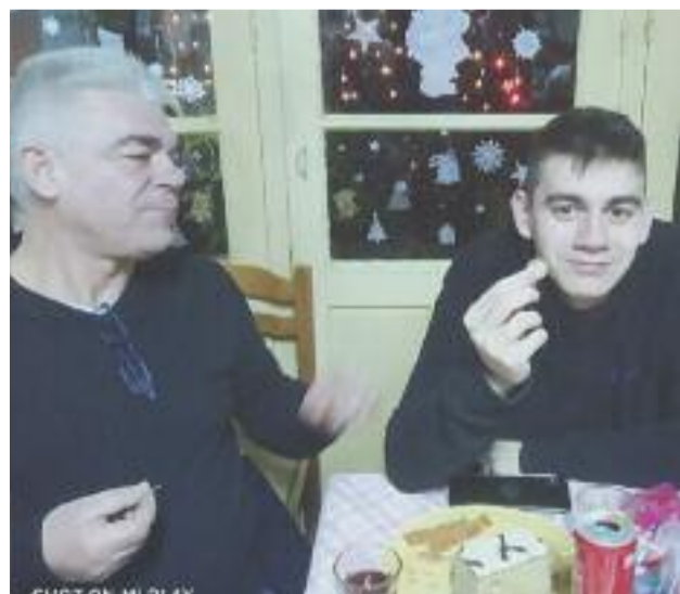
Ο τυχερός του χρόνου