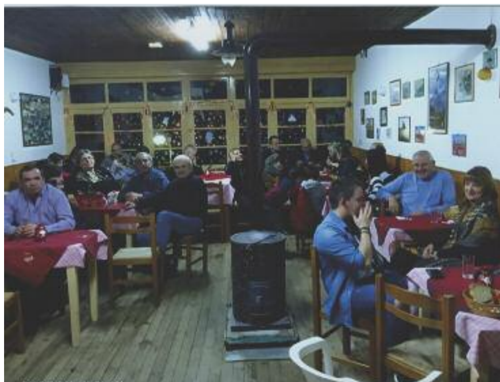
Αποψη στο καφέ ταβέρνα 31-12-'19