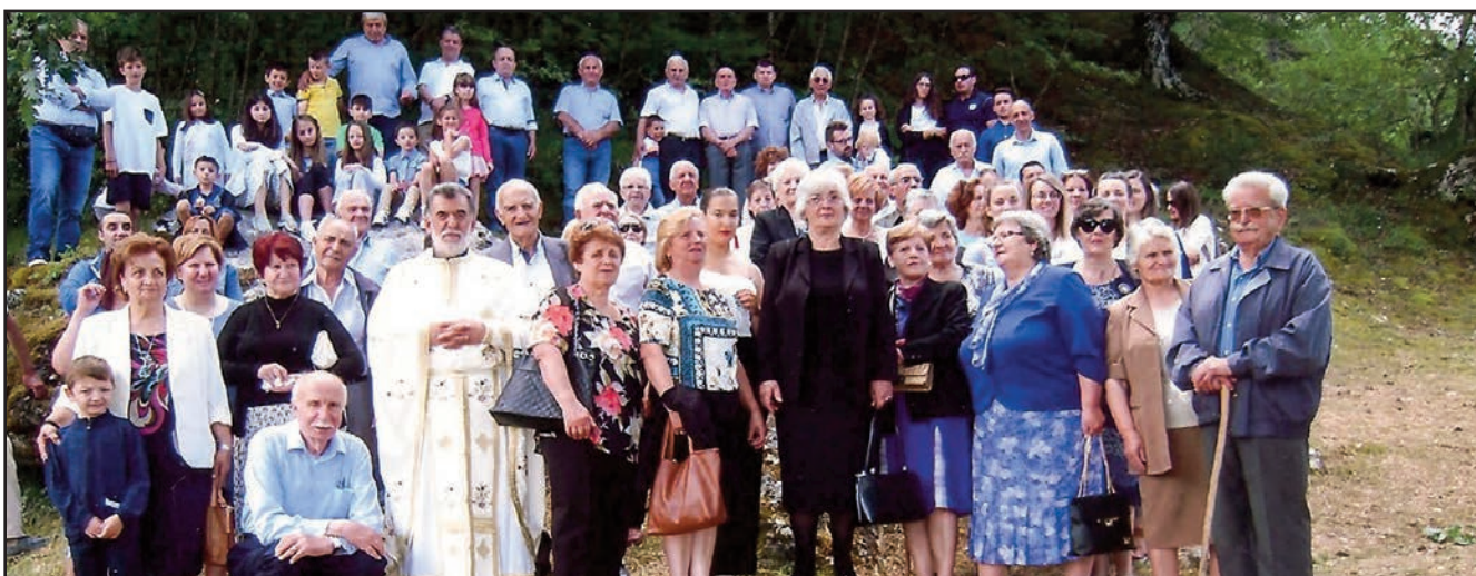
26 Ιουλίου 2018 Αγία Παρασκευή

- Τους συγχωριανούς, φίλους και Ηλιοχωρίτες που συμμετείχαν σε αυτές τις θείες λειτουργίες. Του χρόνου ο πανάγαθος Θεός να μας αξιώσει να λειτουργήσουμε σε όλες τις εκκλησίες και τα εξωκλήσια ένδεκα (11) τον αριθμό.