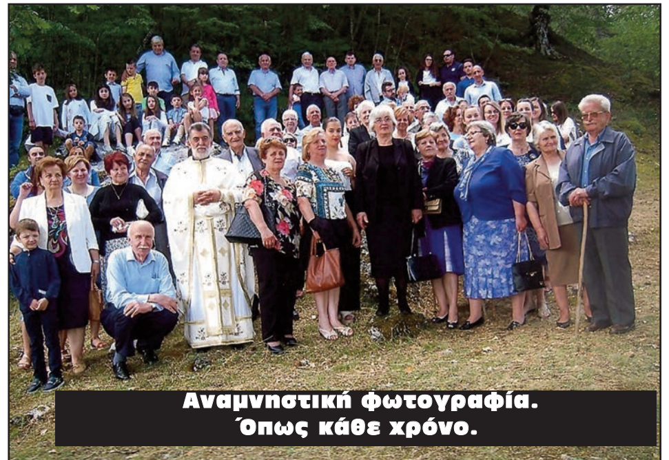
Αναμνηστική φωτογραφία. Όπως κάθε χρόνο.