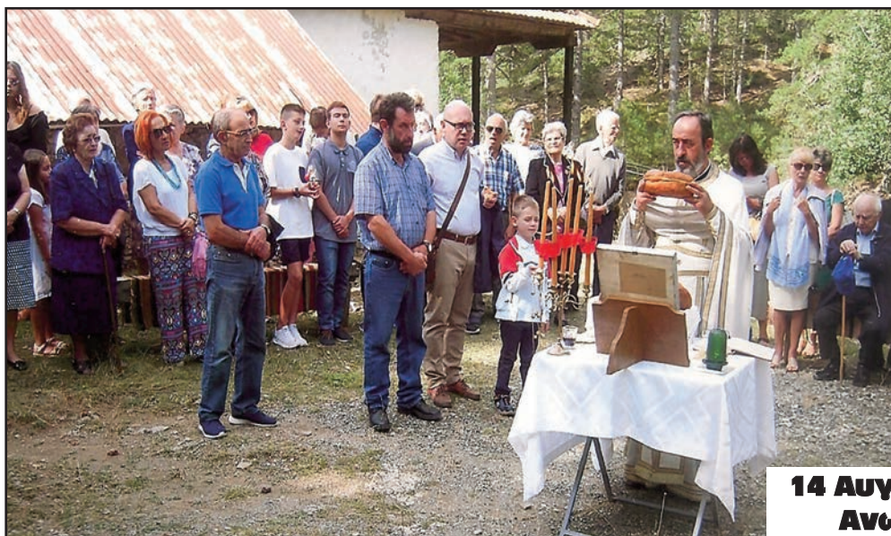
14 Αυγούστου 2018 Άνω Παναγία