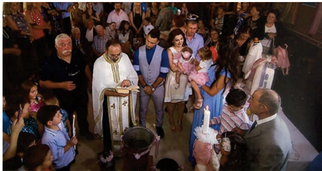
Μια φορά στο Βρυσσχωρί στο χωριό μου στο βουνό, ο νονός θα μου χαρίσει όνομα να πορευτώ