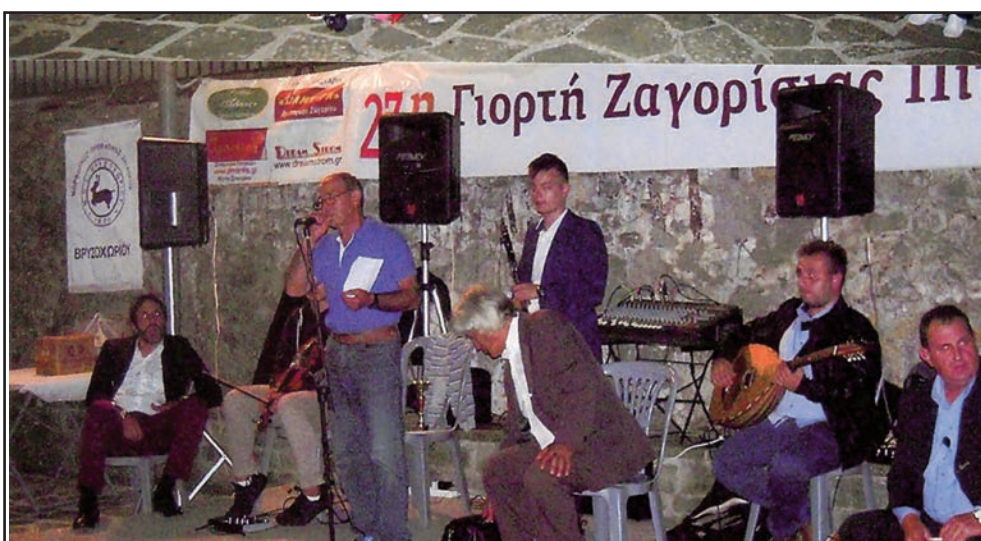
Ο ΧΑΙΡΕΤΙΣΜΟΣ ΤΟΥ ΠΡΟΕΔΡΟΥ

ΥΓΕΙΑ ΚΑΙ ΚΑΛΗ ΣΥΝΑΝΤΗΣΗ σε επόμενες εκδηλώσεις του Συλλόγου