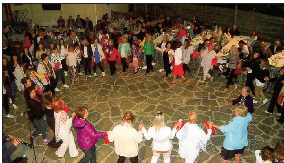
Ο χορός των γυναικών