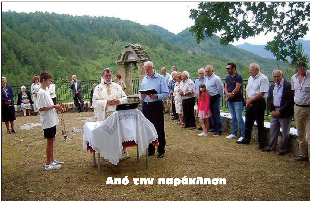
Από την παράκληση

Ο Θεός ας αναπαύσει τις ψυχές των αδικοκαμένων συνανθρώπων μας. Να ευχθούμε να μην γίνονται τέτοιες καταστροφές και τα πανηγύρια θα ξαναγίνουν.