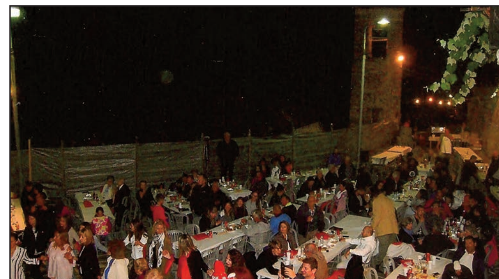
Ένα τμήμα της Πλατείας