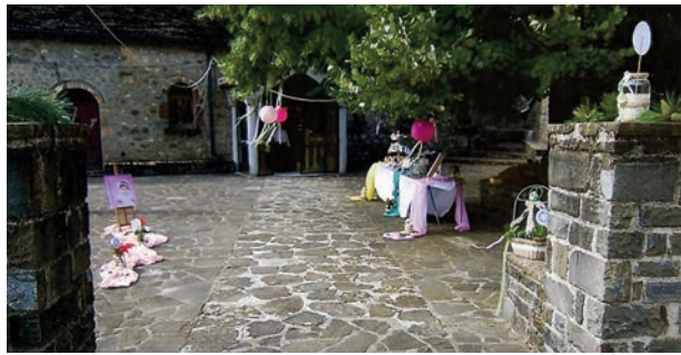
Κόκκινη κλωστή δεμένη, στην Ανέμη τυλιγμένη την μπεμπούλα περιμένει όνομα να της χαρίσει παραμύθι να αρχίσει