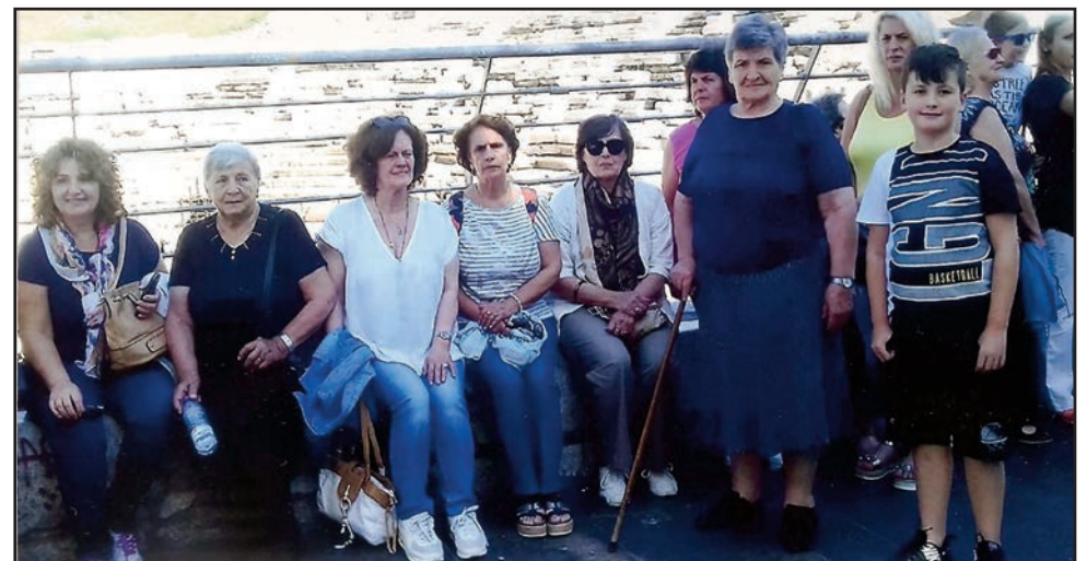
Στο αμφιθέατρο Λάρισας