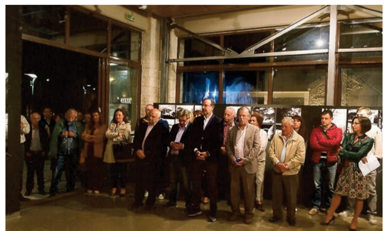
Από τα εγκαίνια της έκθεσης στα Γιάννενα