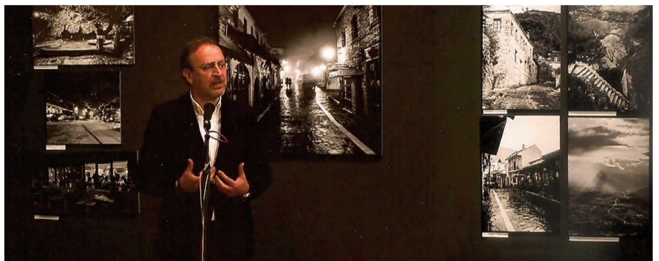
Χαιρετισμός του Δημάρχου Ιωαννιτών