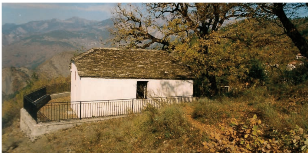
Άγια Παρασκευή πριν την ανακαίνιση