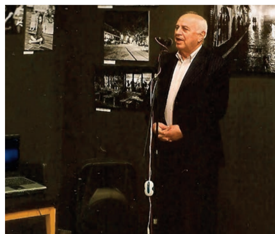
Χαιρετισμός του Δημάρχου Κόνιτσας