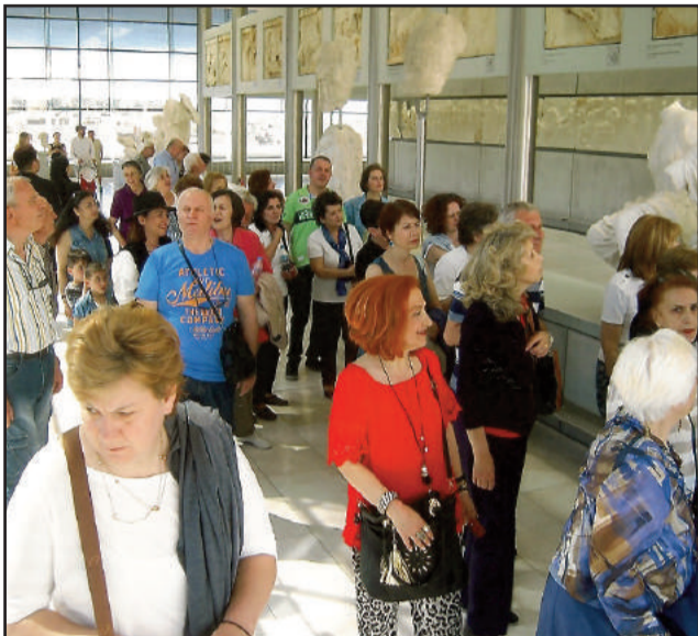
Επίσκεψη - Ενημέρωση στο Μουσείο