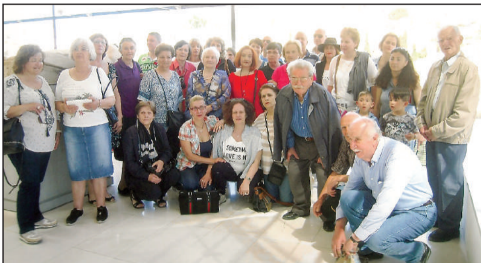
Αναμνηστική εντός του Μουσείου