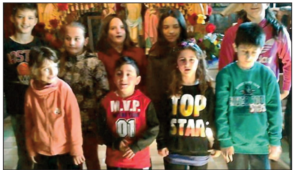
Τα παιδάκια μπροστά στον Επιτάφιο