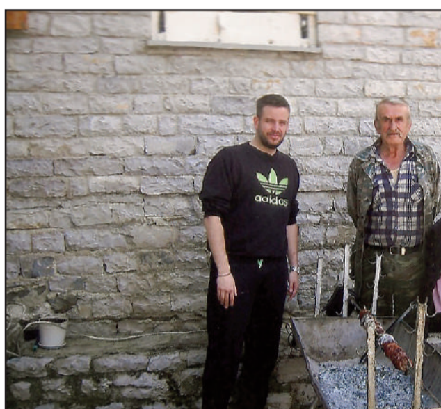
Κοκορέτσι Δημητρίου Δημητράκη