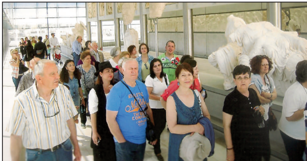
Επίσκεψη στο Μουσείο