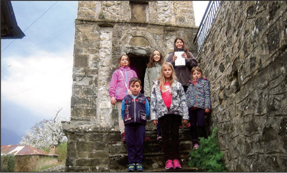
Τα παιδιά στο "ΘΕΣΚΟΥΡΕ"