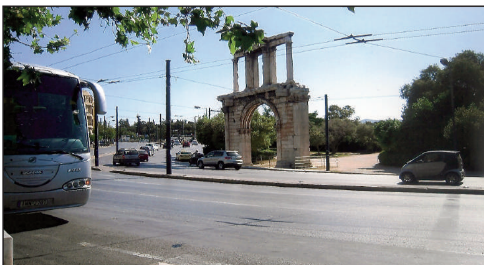
Πύλη Αδριανού Βίβαση αποβίβαση για επίσκεψη στο Μουσείο και Ακρόπολη