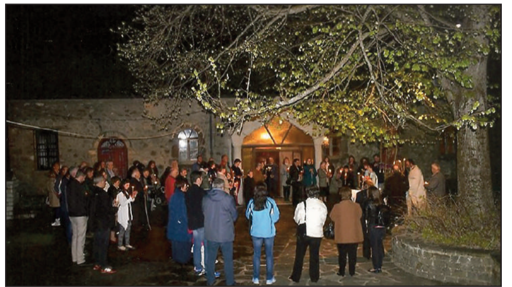
Ι. Ν. Αγίου Δημητρίου Ανάσταση.

τρία χωριά (Βρυσοχώρι - Ηλιοχώρι - Σκαμνέλι) και φέτος κατέβαλε κάθε ανθρώπινη δυνατή προσπάθεια και τα τρία χωριά τις Άγιες αυτές Ημέρες λειτουργήθηκαν κατά τον καλύτερο τρόπο, έτσι με κατανύξη και με τα πατροπαράδοτα έθιμα του χωριού γιορτάστηκε το Άγιο Πάσχα, η μεγαλύτερη γιορτή της Χριστιανοσύνης, της αγάπης, της χαράς, την Ελπίδα και την Ανάσταση . Ο υιός του Θεού εκούσια οδηγείται στα "Άγια Πάθη" σταυρώνεται, θανατώνεται και ανασταίνεται για να σώση τους ανθρώπους από τις αμαρτίες.