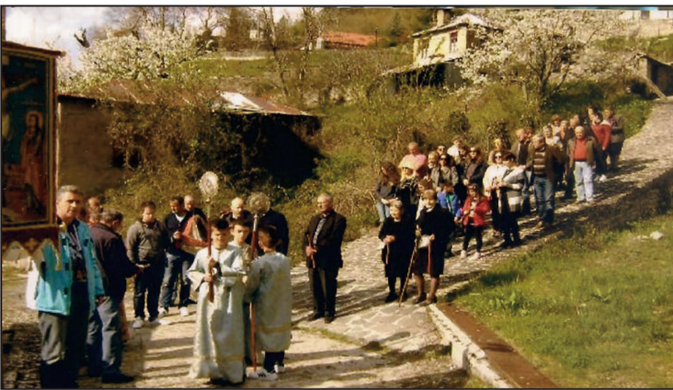
Η περιφορά του Επιταφίου