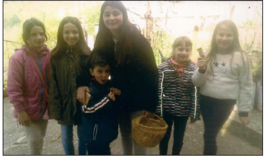
2. Μ. Πέμπτη: Τα παιδιά μαζεύουν τα αυγά.