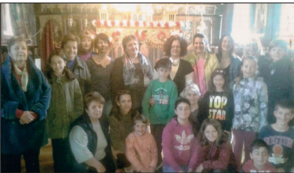
Οι κυρίες που στολίσανε τον Επιτάφιο