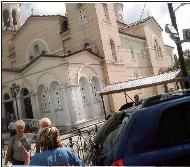
Άγιος Ιωάννης ο Ρώσος