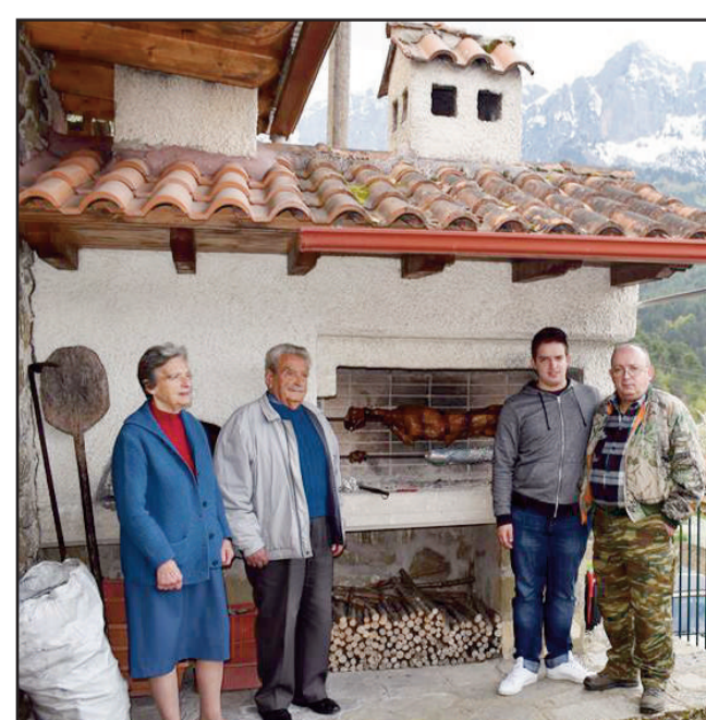
10. Στην ψησταριά του Μπάρκα.