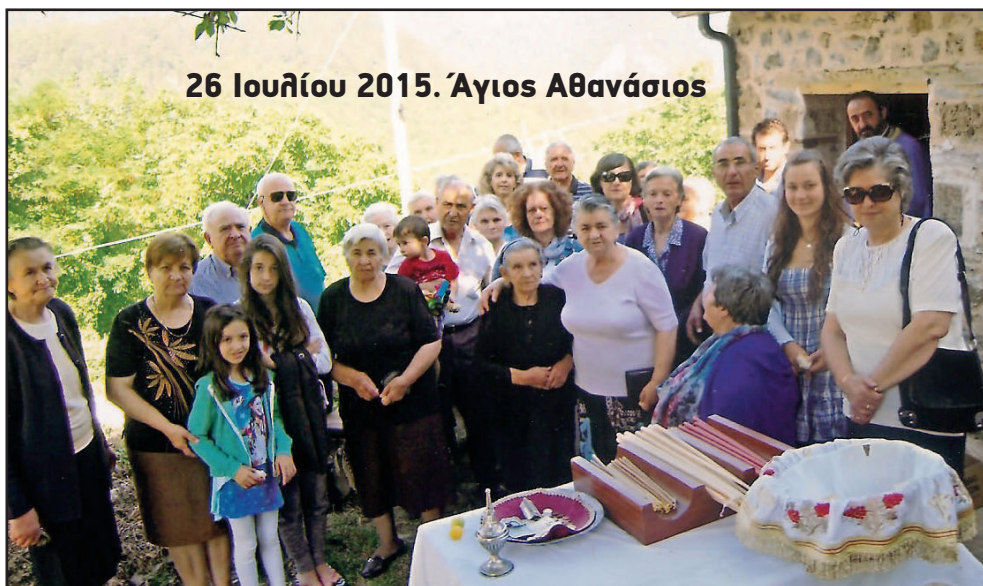
26 Ιουλίου 2015. Άγιος Αθανάσιος