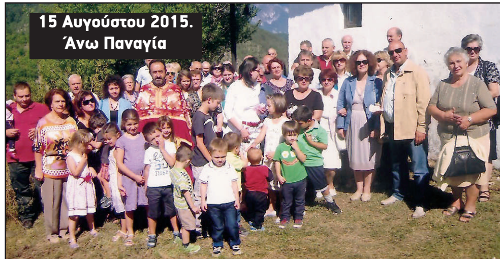
15 Αυγούστου 2015. Άνω Παναγία