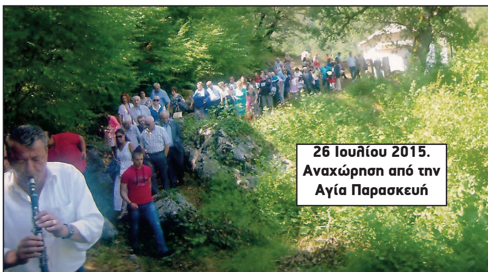
26 Ιουλίου 2015. Αναχώρηση από την Αγία Παρασκευή