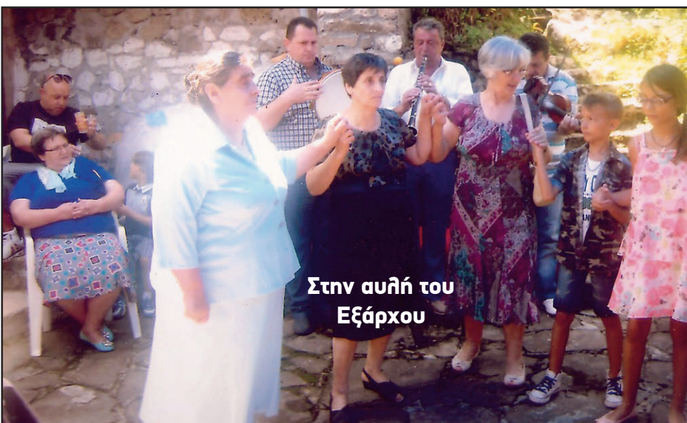
Στην αυλή του Εξάρχου