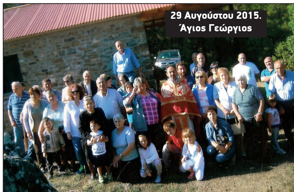
29 Αυγούστου 2015. Άγιος Γεώργιος