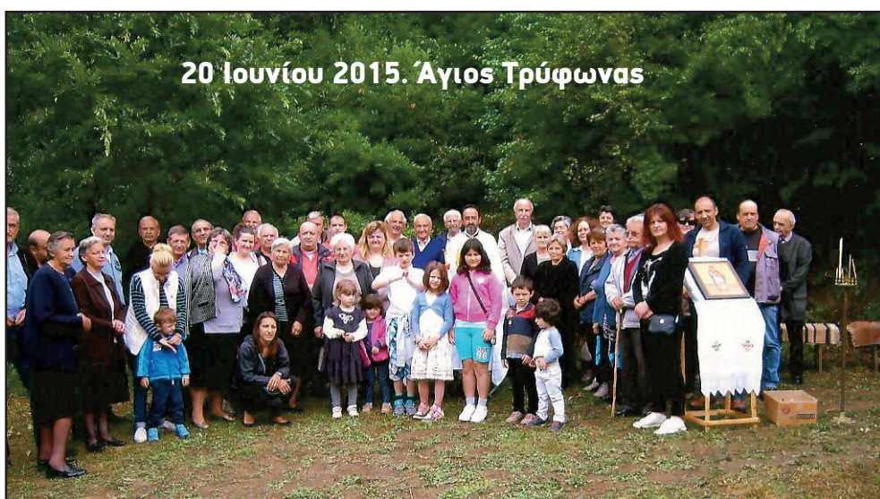
20 Ιουνίου 2015. Άγιος Τρύφωνας

Τους συγχωριανούς και τους φίλους που συμμετείχαν σε αυτές τις θείες λειτουργίες, και του χρόνου να μας αξιώσει ο πανάγαθος Θεός να ξαναλειτουργήσουμε σε όλες τις εκκλησίες.