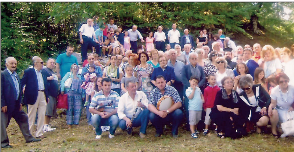
26 Ιουλ. 2015 Αγία Παρασκευή. Αναμνηστική φωτογραφία όπως κάθε χρόνο

Αποτελεί χρέος όλων μας να κρατήσουμε ζωντανό το πανηγύρι του χωριού μας. Γι' αυτό του χρόνου να είμαστε όλοι εκεί.