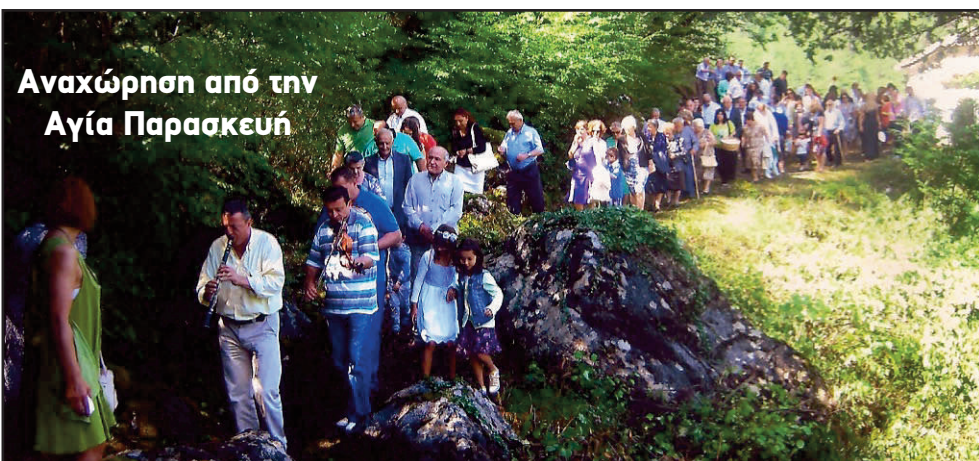
Αναχώρηση από την Αγία Παρασκευή