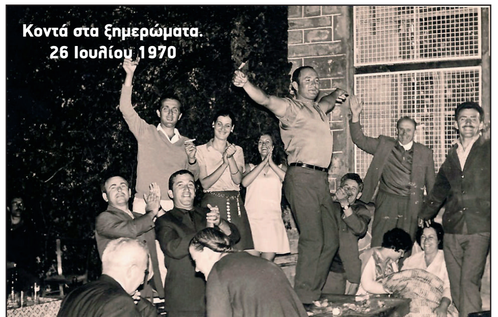
Κοντά στα ξημερώματα. 26 Ιουλίου 1970