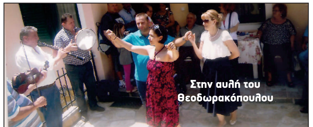
Στην αυλή του Θεοδωρακόπουλου