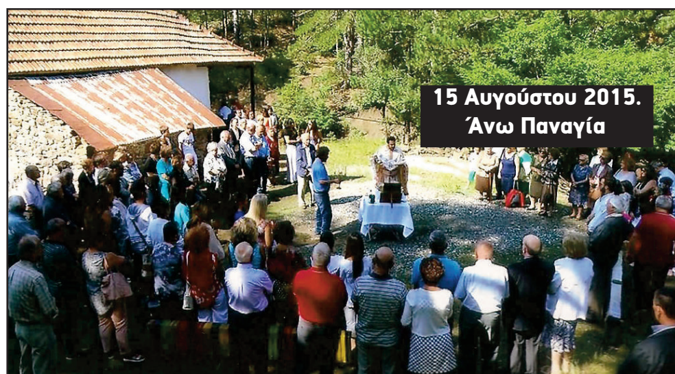
15 Αυγούστου 2015. Άνω Παναγία