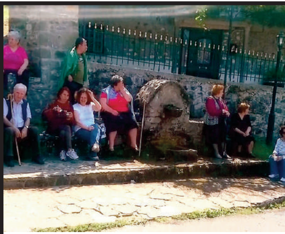
Βρυσσχωρι: Περιμένοντας το φούρναρι

Ο ΜΟΣ και η Συντακτική Επιτροπή συγχαίρει τους επιτυχόντες και τους εύχεται καλές σπουδές.