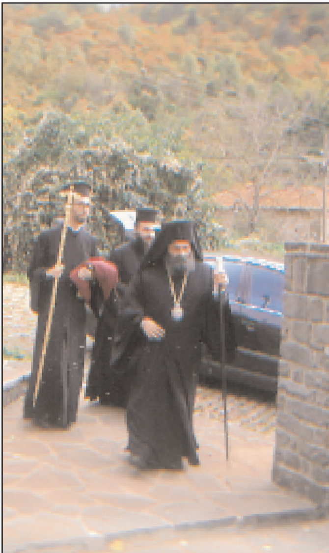
Ο Μητροπολίτης εισέρχεται στον προαύλιο χώρο του Ι.Ν. Αγίου Δημητρίου