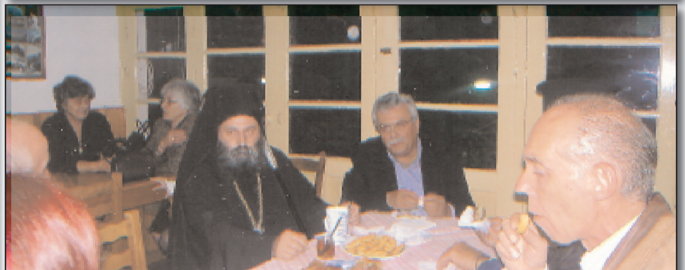
Στη μικρή δεξίωση στο καφενείο του χωριού με τον κ. Δήμαρχο και άλλους χωριανούς