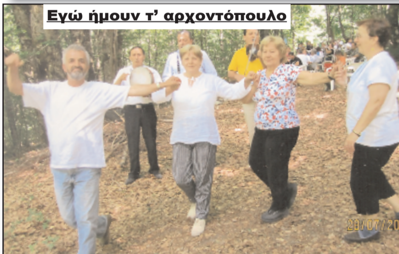
Εγώ ήμουν τ' αρχοντόπουλο