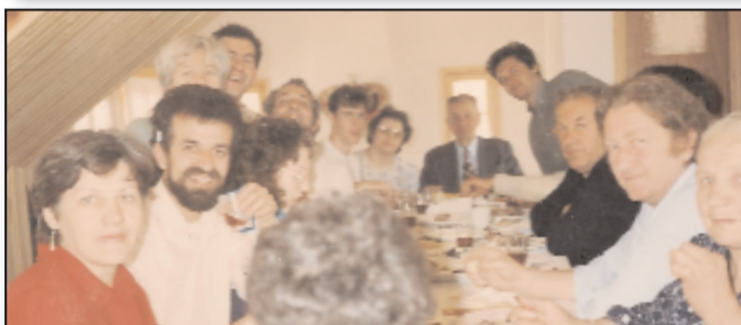
Ευτυχισμένες οικογενειακές στιγμές