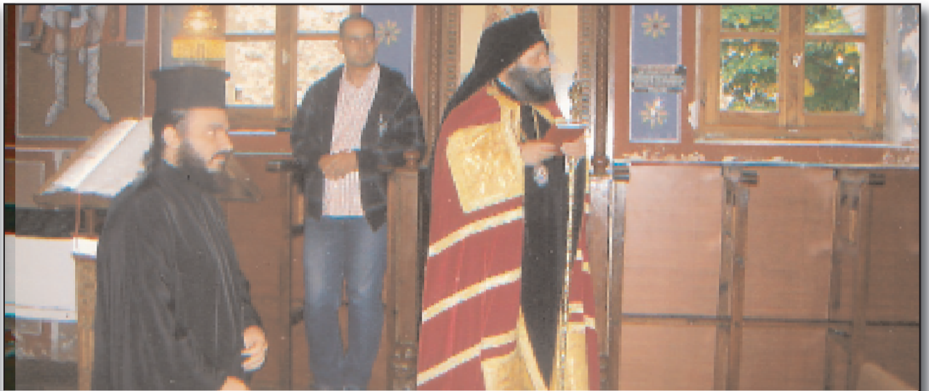
Στο κύρυγμά του από τον Άμβωνα