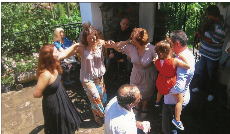
Στου Ευθυμίου Πουποβίνη