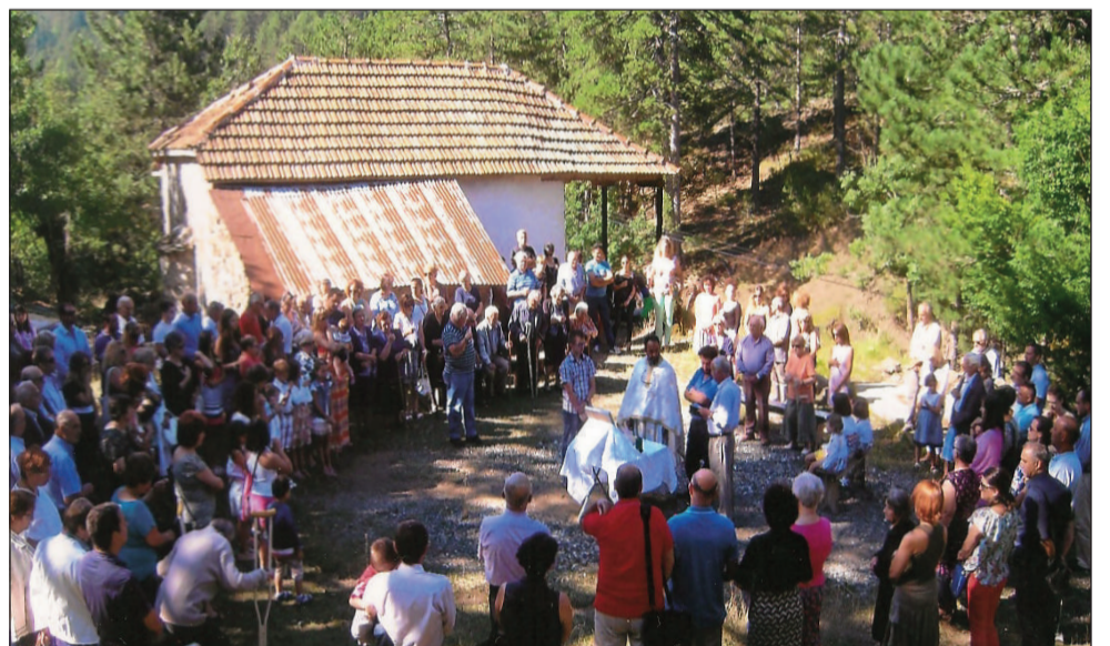
Στην Άνω Παναγία (15-8-2014)