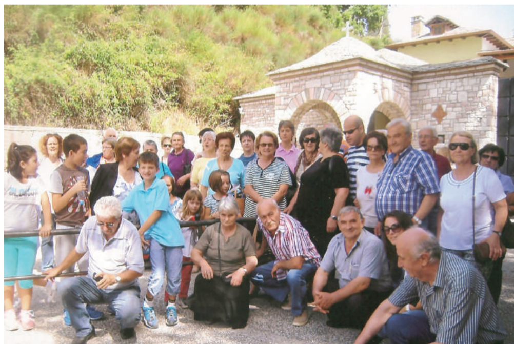
Στην Ιερά Μονή Κορώνης