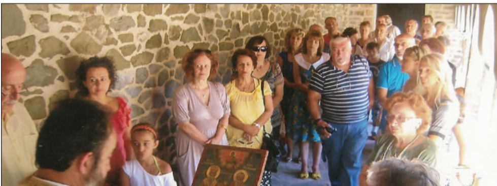
Παράκληση στον Άγιο Χαραλάμπο