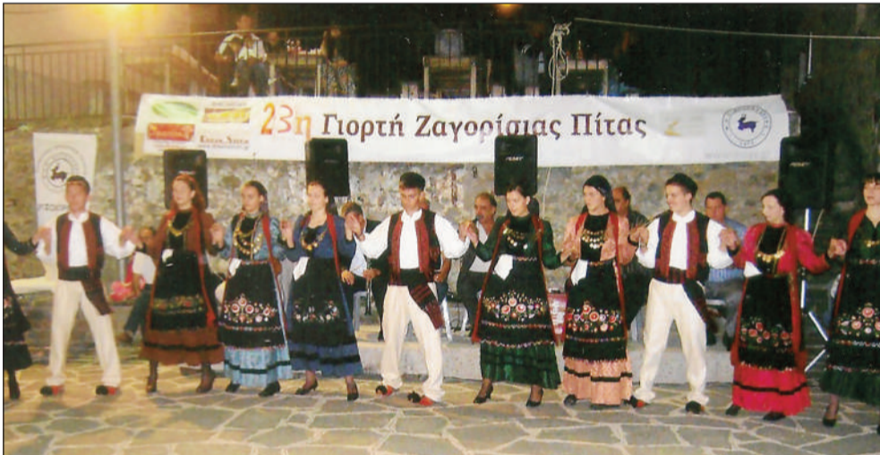
Το χορευτικό μας

-Ευχαριστούμε τον κ. Επαμεινώνδα Γκότση από τη Θεσσαλονίκη για την τηλεοπτική κάλυψη.