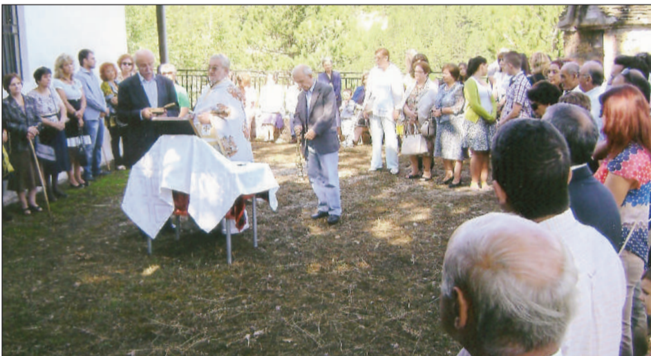
Παράκληση στην Αγία Παρασκευή

ΥΓ. Ήταν η ευχή μετά το πανηγύρι των ξενιτεμένων συγχωριανών μας που με δάκρυα αποχαιρετούσαν συγγενής και φίλους και φεύγανε για τον τόπο διαμονής τους.