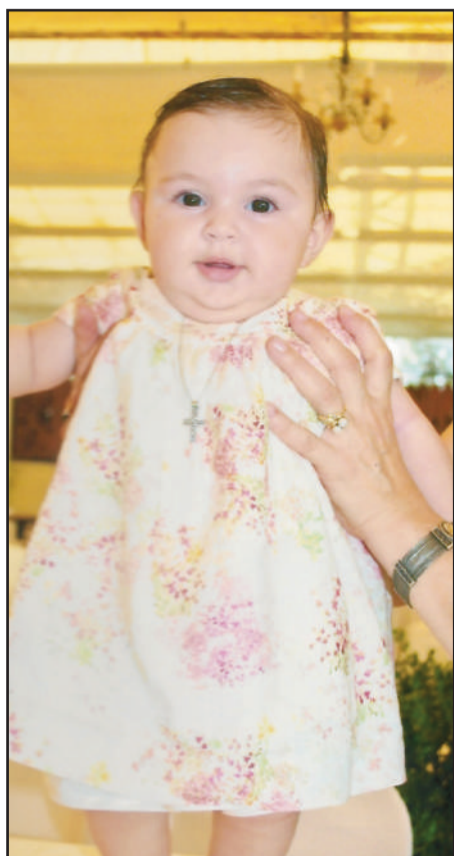
Η νεοφώτιστη Ερμιόνη