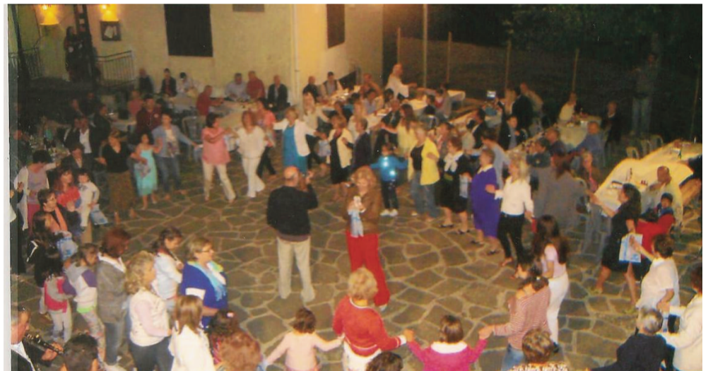
Ο χορός των γυναικών