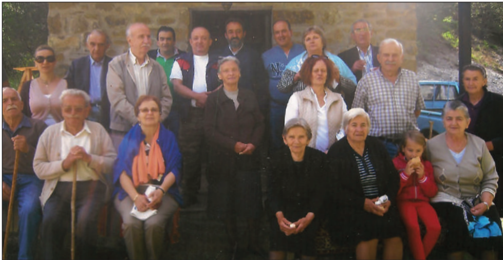
Στον Άγιο Μηνά

• Ο Θεός να του χαρίζει υγεία στον ίδιο και την οικογένειά του, και του χρόνου να μας αξιώσει ο Θεός να ξαναλειτουργήσουμε σε όλες τις Εκκλησίες..