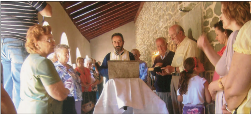
Παράκληση στον Άγιο Χαραλάμπο