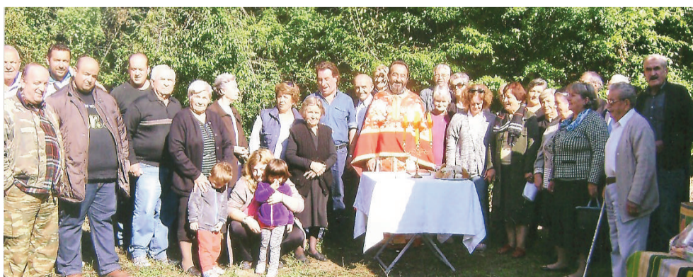
Στον Άγιο Τρύφωνα