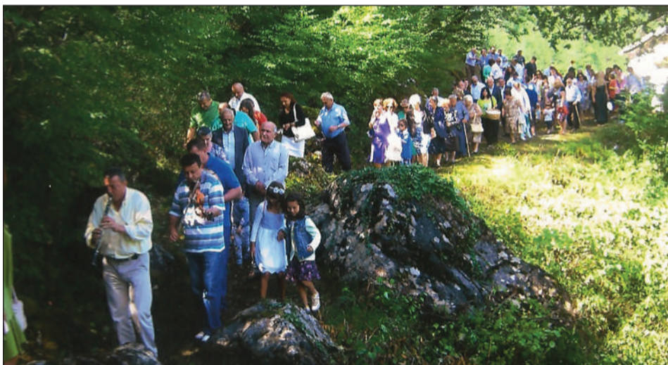
Αναχώρηση από την Αγία Παρασκευή