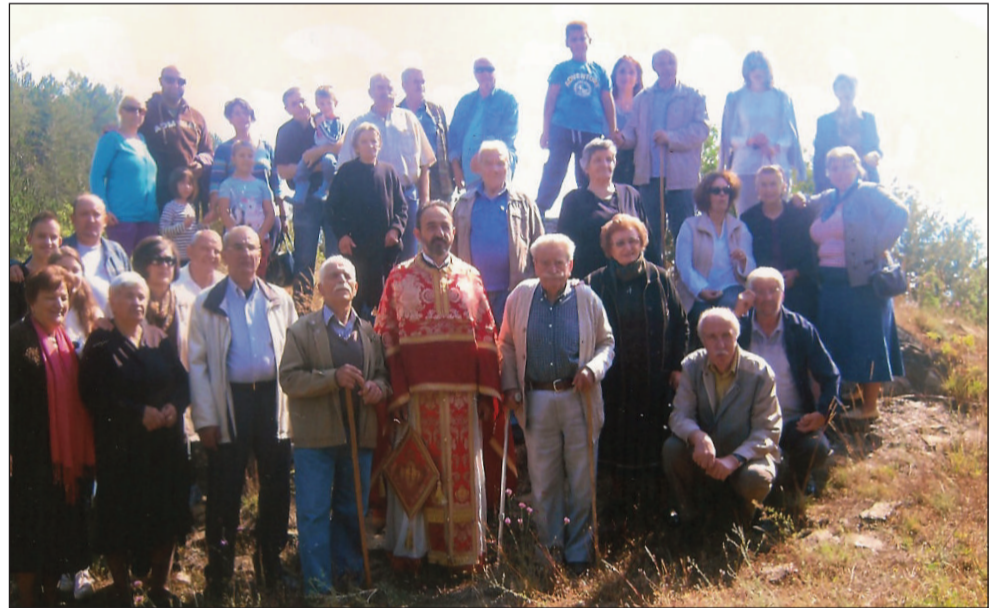
Στον Άγιο Γεώργιο