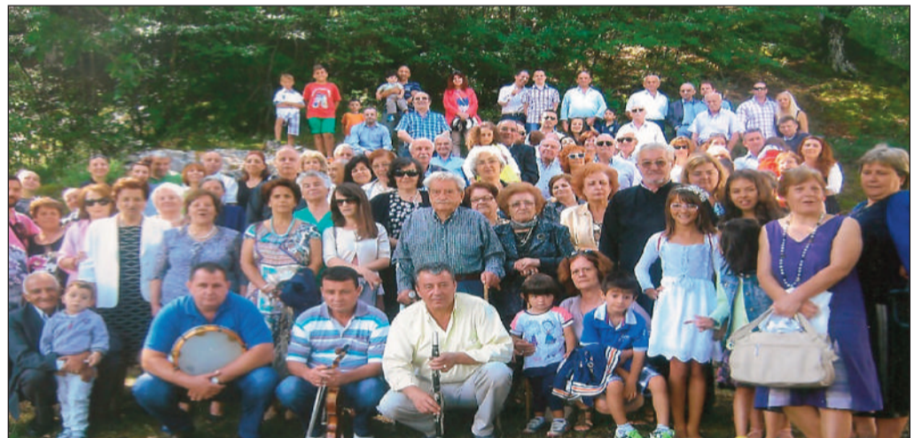
Η αναμνηστική φωτογραφία