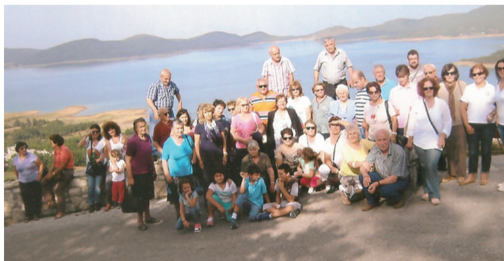
Στη λίμνη Πλαστήρα