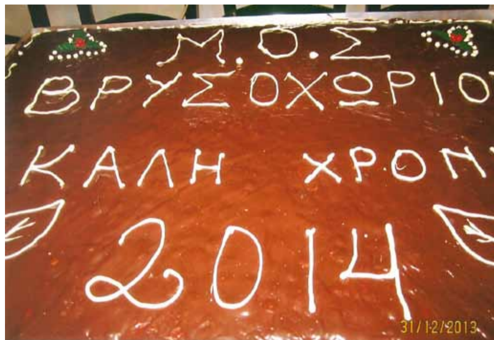
Η Βασιλόπιτα του ΜΟΣ

Ανήμερα των Χριστουγέννων χτύπησε η καμπάνα του Αγίου - Δημητρίου. Ο Παπα-Γιάννης Λεοντάρης καλούσε τους πιστούς στη χαρμόσυνη λειτουργία της γεννήσεως του Θεανθρώπου.