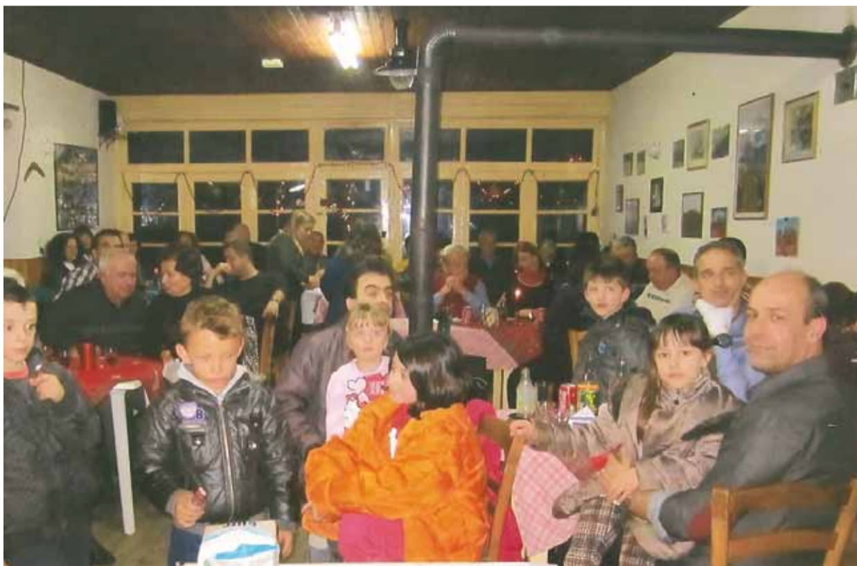
Οι Βρυσοχωριτίες στην Πρωτοχρονιάτικη εκδήλωση