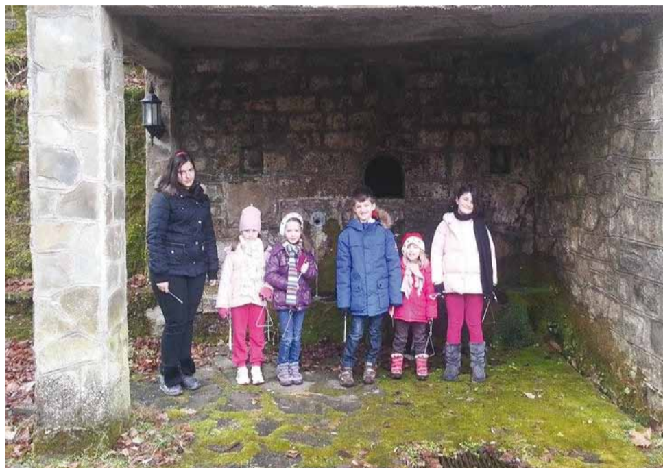
Στα κάλαντα των Χριστουγέννων