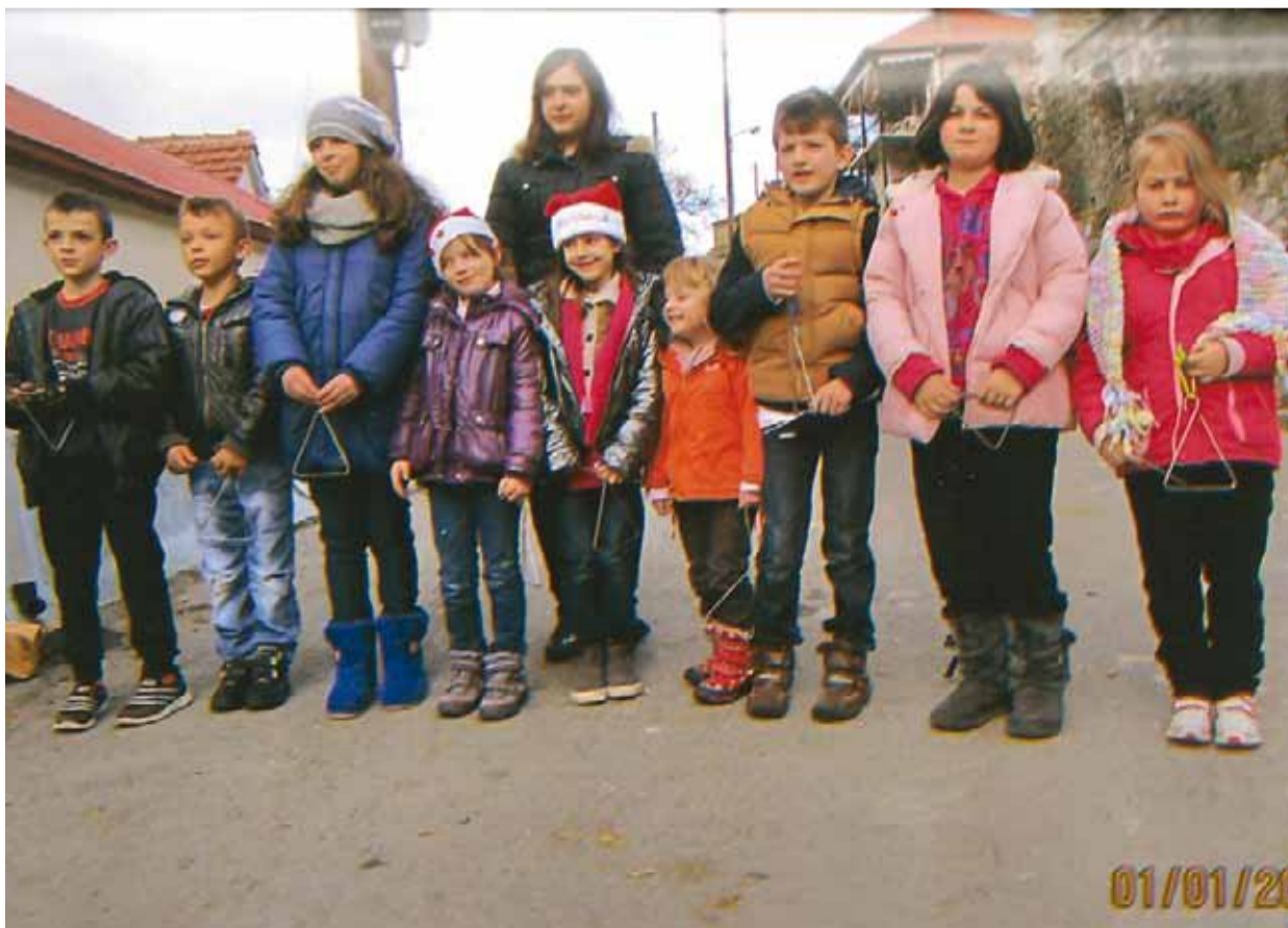
Τα παιδιά στα πρωτοχρονιάτικα κάλαντα