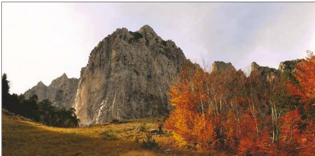
Ανεβαίνοντας προς τα Ριζά, σε συνεπαίρνει η φθινοπωρινή αίγλη των χρωμάτων

μας έβγαζε στα οροπέδια που αγναντεύουν τα βουνά (Αλάκο;). Τα αγριοπλατάνια ήταν στο κύκνειο άσμα τους, κόκκινα και πορτοκαλιά, μόλις που τα προλαβαίναμε. Κόψαμε τον δασικό δρόμο κι ανεβήκαμε στο οξύ δάσος ακολουθώντας το μονοπάτι «Ιωάννης Τσουμάνης» . Εναλλασσόταν τα κοκκινοπορτοκαλιά με τα χαλκόχρυσα. Και ψηλά ορθωνόταν η αιγυματική κορυφή. Πού αλλού να δουν τέτοιο θέαμα; Βγήκαμε από το οξυόδασος για την τελευταία ανάβαση. Λίγο αγκομάχημα τώρα. Και να, για τους πιστούς, τα ριζά της κορυφής. Σταθήκαμε. Το μάτι μας περιπλανήθηκε ολόγυρα, να το Αυγό Βοβούσας , να το Φλάμπουρο Λάιστας , η Μόσια , ο γεροΣμόλικας , ο Κλέφτης , ο Λάκμος , ανοιχτοί οι ορίζοντες, γαλανός ο