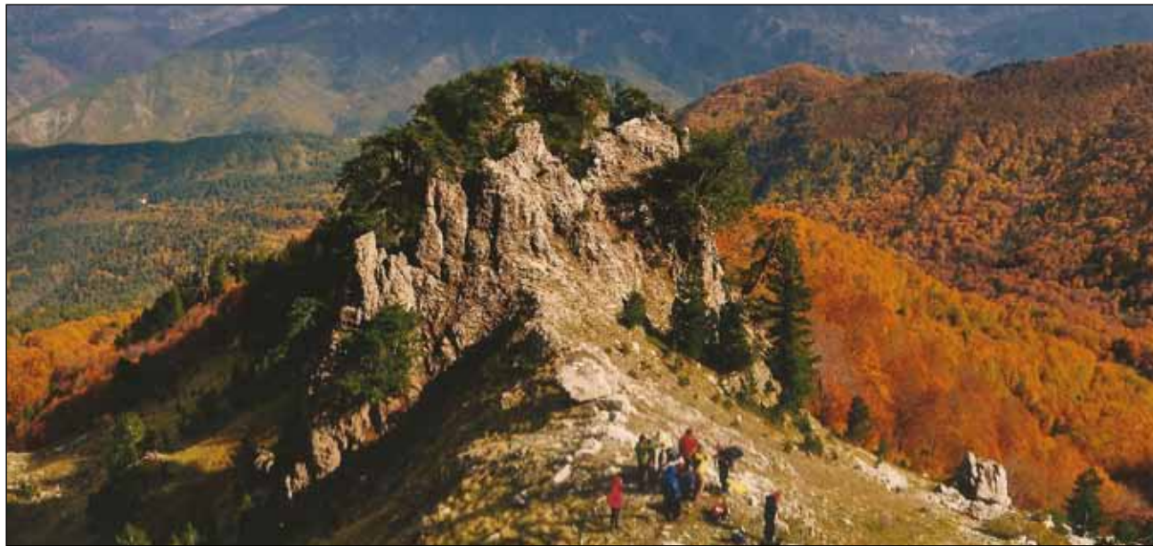
Κατεβαίνοντας το βλέμμα πλανιέται στην καλύτερη ώρα του φυλλοβόλου δάσους

ουρανός με λίγα περιπλανώμενα σύννεφα. Μα το θέαμα που σε καθήλωνε ήταν οι ορθοπλαγιές δίπλα μας της Τσουκά Ρόσσας - Γκούρας. «Δεν μας... πιάνεται που δεν ανεβαίνω στην κορυφή» , μου είπε αξιόμαχος ορειβάτης. «Η κορυφή από εδώ είναι αναρριχητική κι από την πίσω πλευρά τόσο επικίνδυνη που ελάχιστοι ορειβάτες την επιχειρήσαν. Βολέψου με λίγο σκαρφάλωμα από εδώ και καμιά φωτογραφία» . Αφήσαμε τους ορειβάτες