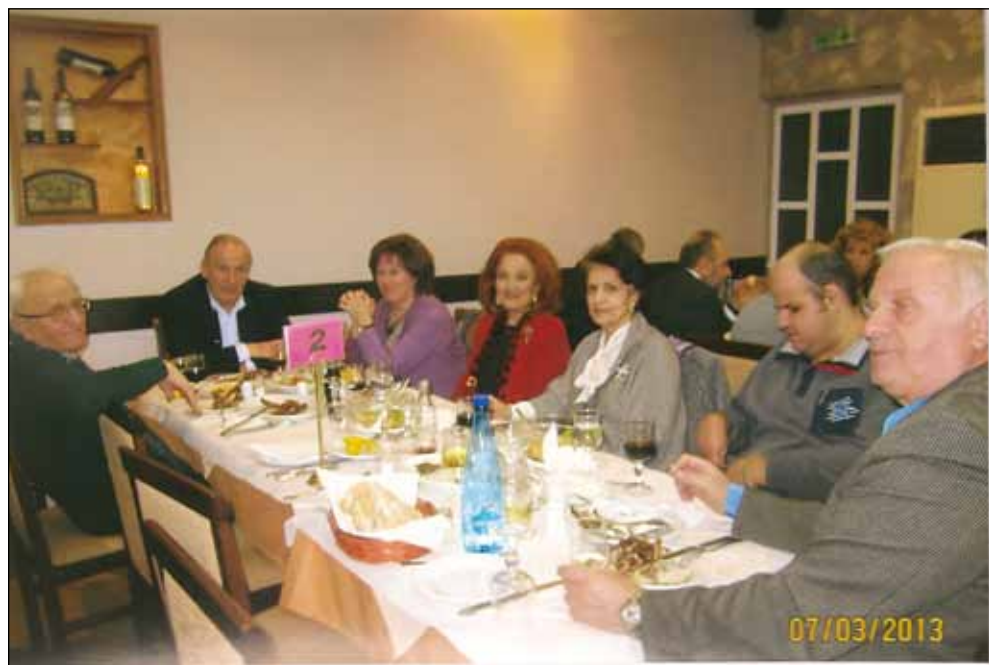
Μερικές από τις παρέες Βρυσσοχωριτών και φίλων της συνεστίαςης της Τσικνοπέμπτης στο κέντρο «ΑΛΕΚΟΣ»