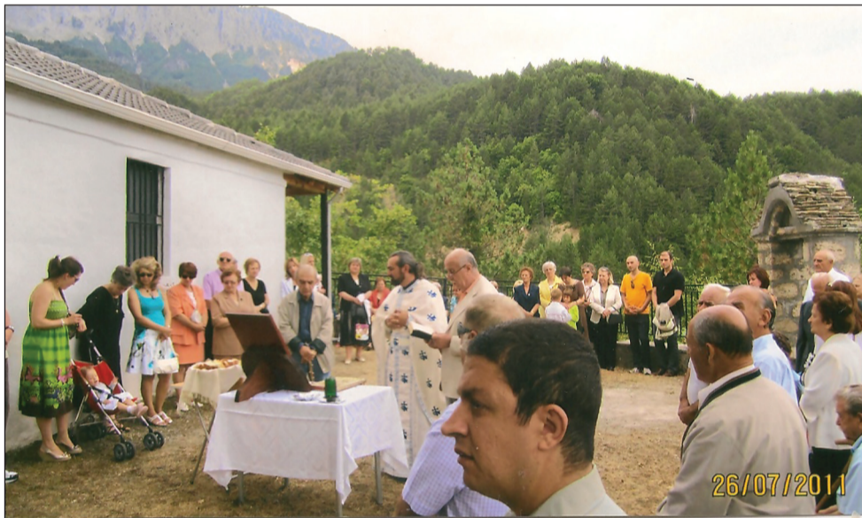
Παράκληση Αγ. Παρασκευής