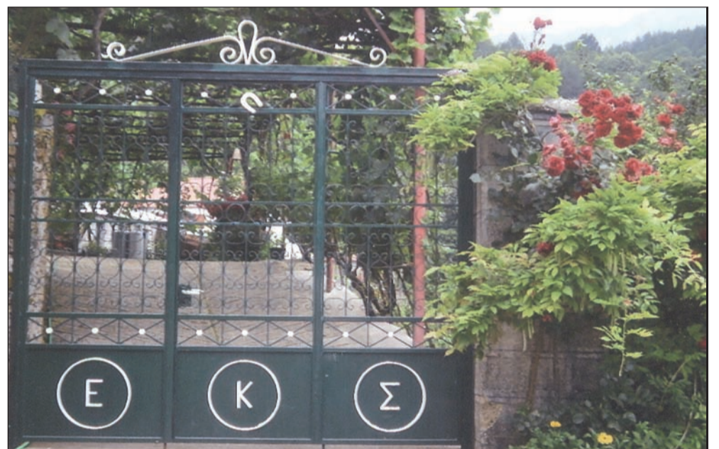
Ένας όμορφος ομπρός με λουλούδια στο Βρυσχώρι του Ευάγγελου Κων/νου Σιαμπίρη