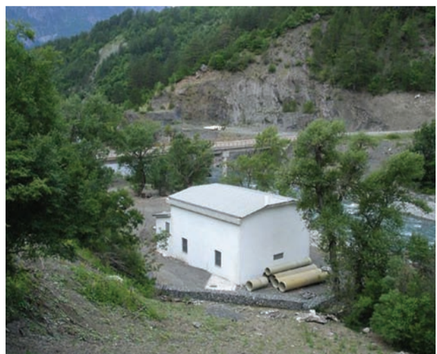
Υδροηλεκτρικό εργοστάσιο Βρυσοχωρίου, θέση «ΑΠΙΑΣΙΓΚΟΣ»