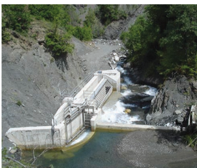
Υπερπηδητό φράγμα υδροηλεκτρικού εργοστασίου Βρυσοχωρίου, θέση «ΤΣΙΟΥΜΠΟΥ»