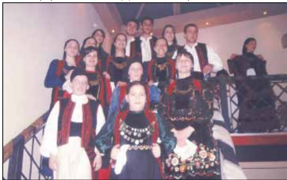
ΧΟΡΕΥΤΙΚΟΣ ΟΜΙΛΟΣ ΒΡΥΣΧΩΡΙΟΥ Κοσμικό Κέντρο «ΜΟΥΣΕΣ» 20-2-2010