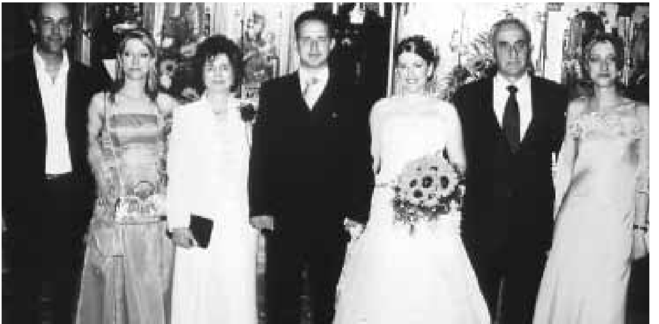
Από τις ευτυχισμένες στιγμές του αείμνηστου Αδαμαντίου στο γάμο του γιού του

Και να το θαύμα!!! Ο Θεός αργεί αλλά δε λησμονεί. Έπεσε το αίμα στα παιδιά, στους απογόνους των αρχιερέων. Έπειτα από δυο χιλιάδες χρόνια περίπου, κατά τον δεύτερο παγκόσμιο πόλεμο, οι Γερμανοί εξόντωσαν έξι εκατομμύρια Εβραίους!!!